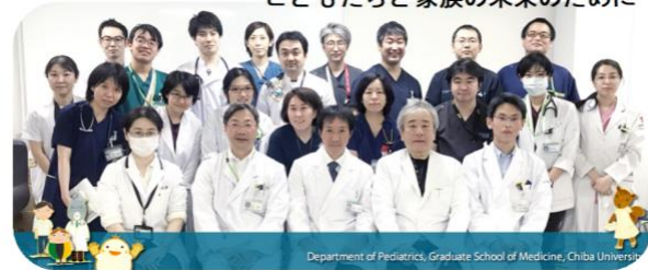
Department of Pediatrics, Graduate School of Medicine, Chiba University

学内には 豊富な指導医が 揃っています 血液腫瘍 感染症 内分泌・代謝 免疫・アレルギー 循環器 神経 新生児 遺伝子診療 児童虐待