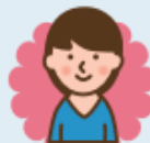
ソーシャルワーカー

治療と生活の両立にあたっての相談を受けたり、他院や地域サポーターとの橋渡しを行う存在。