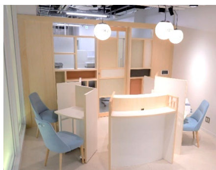
受付：独自の個別呼び出しアプリを導入

なお、「東洋医学センター 柏の葉鍼灸院」は、千葉大学柏の葉キャンパスにおいて診療を継続しています。