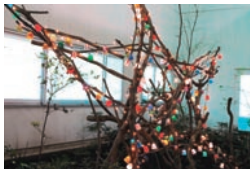
ランプシェードで飾られたモニュメント

師走に入り一段と厳しい寒さを迎えた12月3日、外来診療棟地下1階入口からバスロータリーへと続く「ヒュギエアの庭」に、クリスマスイルミネーションが設置されました。 千葉大学病院では、年に数回、外来ホールにおいて患者さんに心の安らぎを感じていただくために、各種コンサートを開催してきましたが、昨年は新型インフルエンザの流行により、クリスマスコンサートの開催が中止となりました。 このコンサートに代わるものを模