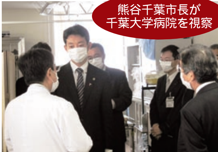
熊谷千葉市長が 千葉大学病院を視察