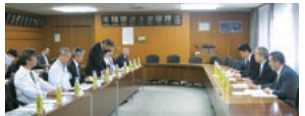
意見交換会の様子

の様子を視察、病院関係職員から説明を受けました。千葉大学病院は、建設からすでに30年が経過し、現在では1日あたりの外来患者数が、設計時に想定された1,200人を大きく上回る約2,000人となっており、すでに超えている状態。外来患者数は今後も増加していくことが予想され、本院ではこれに対応するため