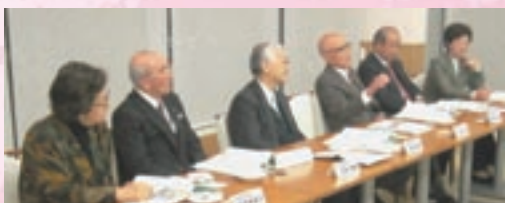
医療のあるべき姿や千葉大学病院の運営など意見交換をする出席者

この懇談会は、千葉大学病院の実情を理解していただくとともに、学外の有識者から、医療のあり方や病院の運営などについて自由に意見交換していただくことが目的で、この日は「優れた医師を確保するため、どんな見直しを持っているのか？」といった質問や「女性が医療現場でいきいきと継続して働ける仕組みをつくるべき」といった提言など、活発な議論が行われました。