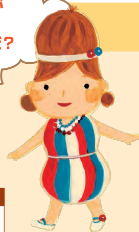
病院公式キャラクター ぴな子ちゃん