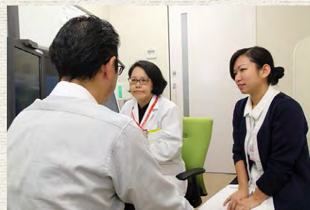
患者さんのお話を聞きながら、二人三脚で禁煙をサポート

ご予約は… 呼吸器内科外来(当院2階) Tel. 043-222-7171 (代表)