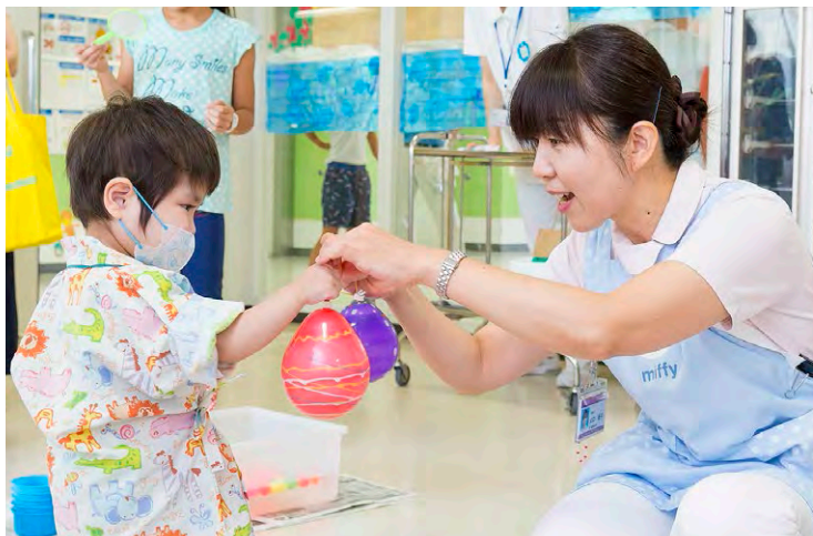
不安や痛みでつらいときにはそっと寄り添うだけのことも… 退院後に成長した姿を見せてくれる子もいます

長期入院中に誕生日を迎える子には、お誕生日カードを作ってスタッフみんなでお祝っています