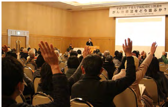
前回は約200名が参加しました

公開講座を毎年開催しており、例年同様、がんに関する基礎知識、当院におけるがん治療への取り組みをご紹介します。詳細は決まり次第、院内掲示、ホームページなどでお伝えします。乞うご期待!