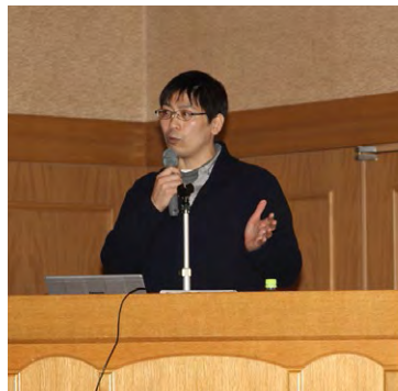
患者さんの体験談も予定しています